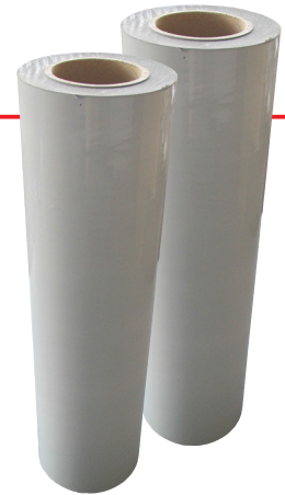
Folie schützt Fallrohr (z.B. bei Putzarbeiten)