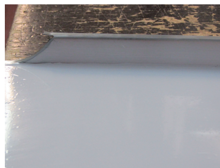
Beklebte Schare bei einer Doppelstehfalzdeckung